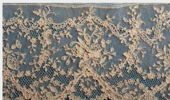
Volant, Points d'Argentan et d'Alençon, réalisé par l'école dentellière d'Argentan d'après un modèle Lefébure, fin XIX e siècle, lin. Prêt de l'abbaye Notre-Dame d'Argentan.

Abbé Leboulanger, Histoire du Point d'Argentan, 1910. Couverture en Points d'Argentan et d'Alençon, Bénédictines d'Argentan, début du XX e siècle, lin. MDD Argentan (dépôt collection particulière).