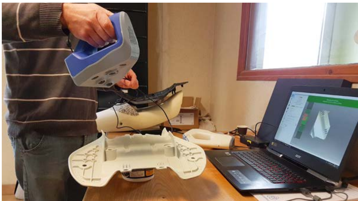
L'entreprise de plasturgie Leprince Borel à Trun. Acquisition d'un scanner 3D. Le Département y attribue une aide de 5 000 €.

MAINTENIR LE COMMERCE ET L'ARTISANAT EN MILIEU RURAL , dans les centres-bourgs et centres-villes, c'est l'objectif du Département à travers les aides à l'investissement qu'il alloue aux projets présentés par les quatre Pays Ornais (1) . Exemples dans le Pays d'Argentan, d'Auge et d'Ouche.