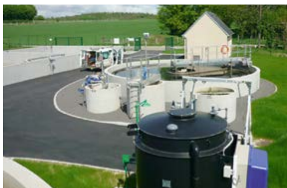
La nouvelle station d'épuration inaugurée à Moulins-la-Marche en mai dernier.

Le Département poursuit sa politique d'aide aux projets des collectivités pour l'alimentation en eau potable et le traitement des eaux usées.