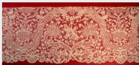
Bas d'aube, Point d'Argentan, XVIII e siècle, lin. MBAD Alençon.