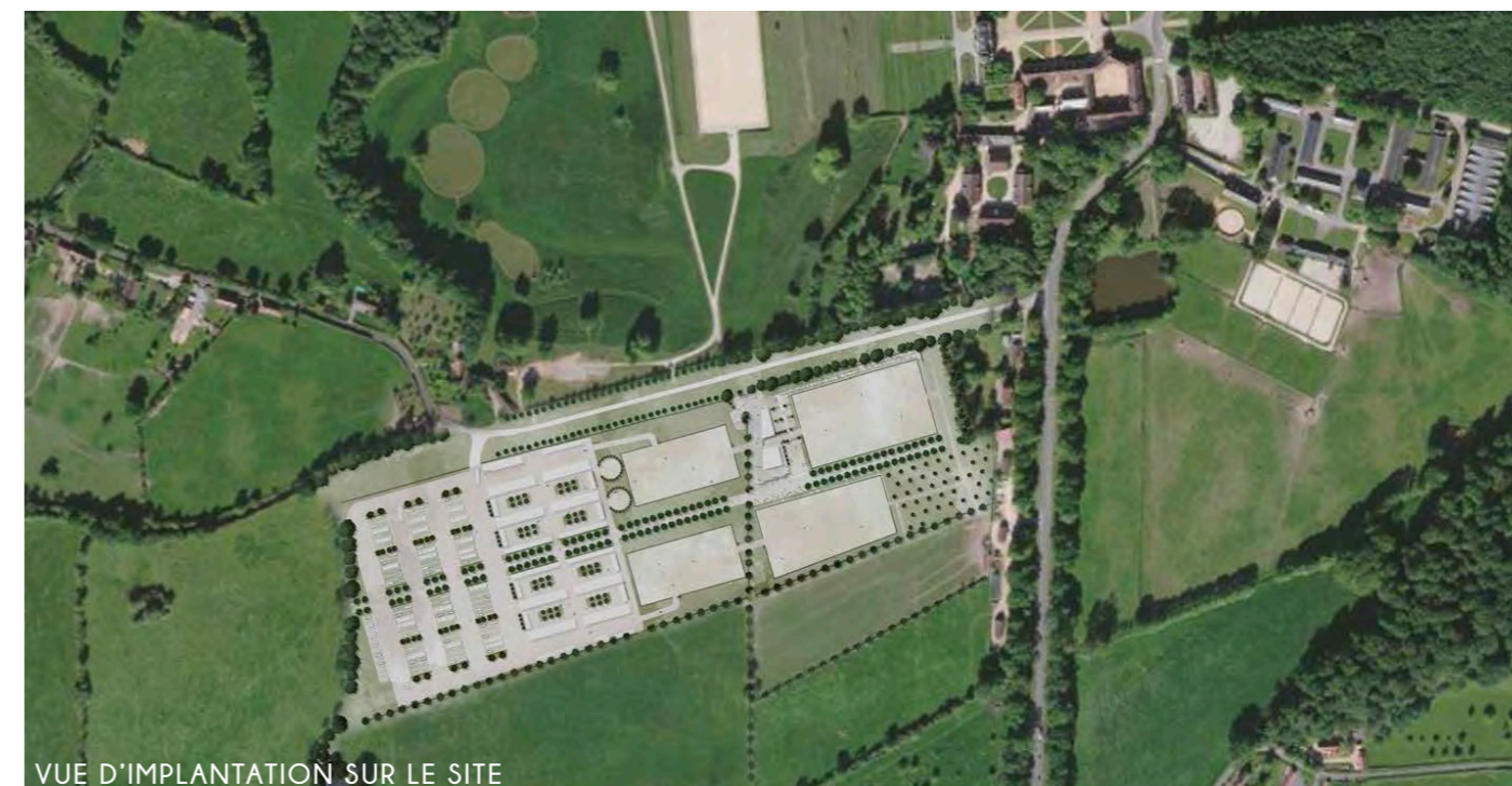
VUE D'IMPLANTATION SUR LE SITE