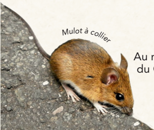
Mulot à collier

Au menu de notre chouette, principalement du Campagnol des champs, du Campagnol roussâtre, de la Musaraigne musette, et du Mulot sylvestre et plus rarement, du Mulot à collier.